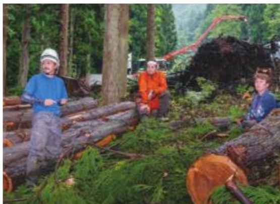
林業は危険な仕事だからこそ、チームワークが重要だ。「この仕事に就いて良かったことのひとつは、かけがえのない仲間との出会いです」

と。あと遠距離恋愛中に南魚沼市を何 度か訪れていて、自然いっぱい良いと ころだと思っていたので、山を整備する 仕事は自然を守り、人の役に立つ仕事 だと思いました。